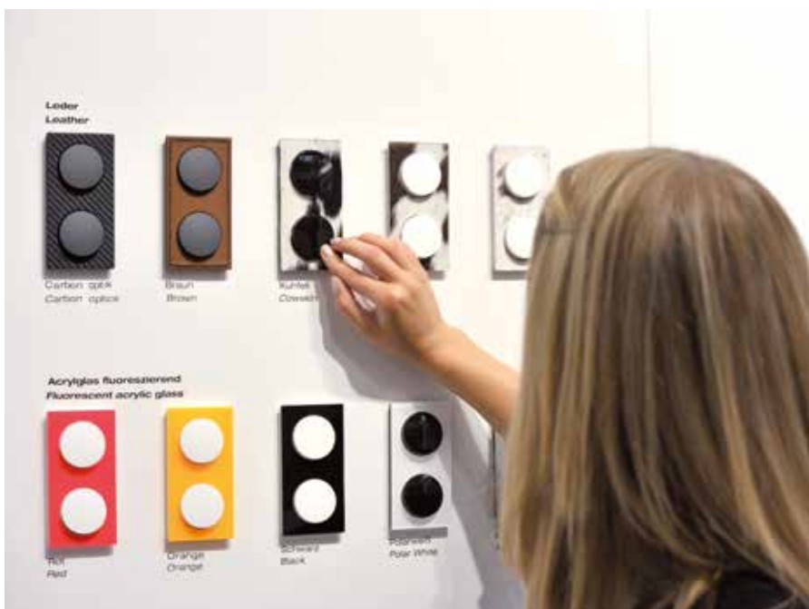
Zowel een aantrekkelijk design is van groot belang, maar ook een perfect functionerende techniek.

"We bieden klanten innovatieve, veilige en duurzame oplossingen. Denk daarbij aan de Berker Radio Touch, eenvoudig te integreren in bestaande of nieuwe elektrische installaties, geschikt voor MP3 spelers. De combinatie van radio en luidspreker vereist slechts één inbouw contactdoos voor elk apparaat. Leverbaar in RVS en poolwit. De ontwikkelingen in techniek gaan snel; dat heeft ook zijn uitwerking op het interieur. We zien daarin steeds meer technische snufjes verwerkt. Een aantrekkelijk design is daarbij van groot belang, maar een perfect functionerende techniek is nog veel belangrijker. Deze combinatie is zeker bij artikelen die wij produceren essentieel."